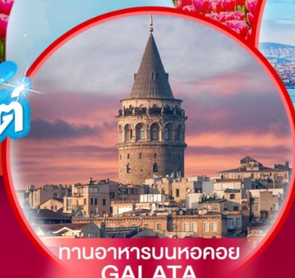
ทานอาหารบนหอคอย GALATA