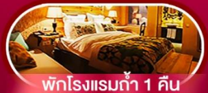
พักโรงแรมท่า 1 คืน